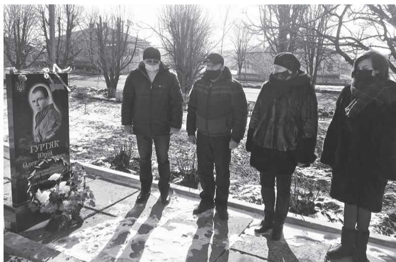
Покладання квітів до пам'ятного знаку на честь загиблого героя Юрія Гуртяка у селі Містки

Будьмо гідні героїв, які віддали свої життя за нашу свободу та право на незалежність. Слава героям, які ніколи не вмирають!