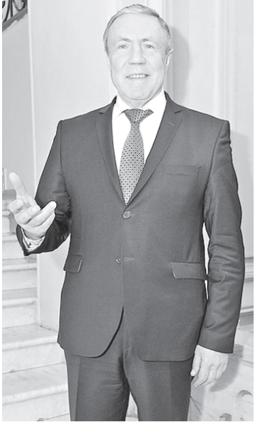
Талант від Бога й батьків